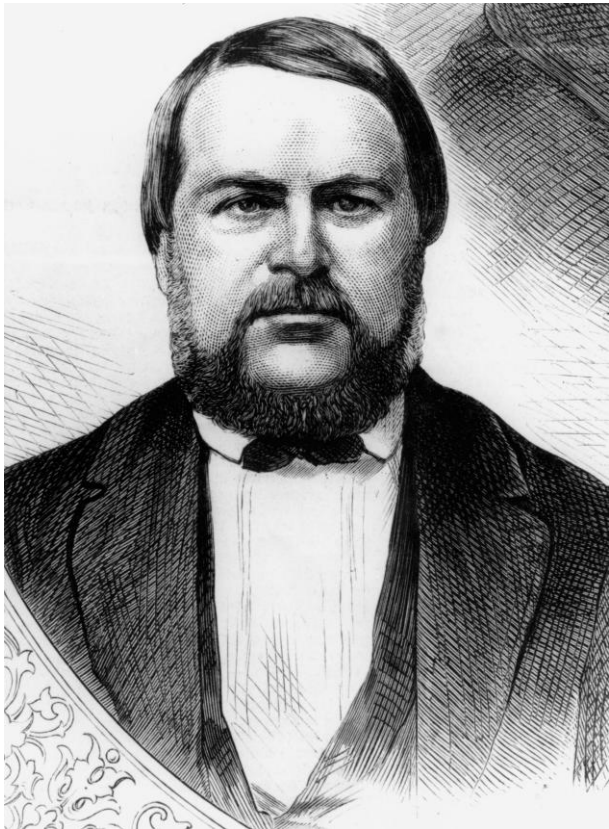
Porträt von Hermann Schaaffhausen.

Fotografien in Druckqualität finden Sie auf der beigelegten CD oder auch zum Herunterladen auf unserer Homepage im Pressebereich unter folgendem Link: http://www.landeseuseum-bonn.lvr.de/de/presse/pressematerial_neu/pressematerial_neu.html .