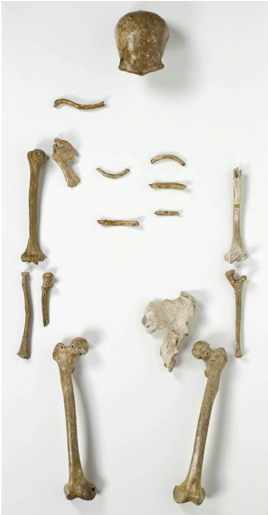
Das Skelett des Neandertalers. LVR-LandesMuseum Bonn.