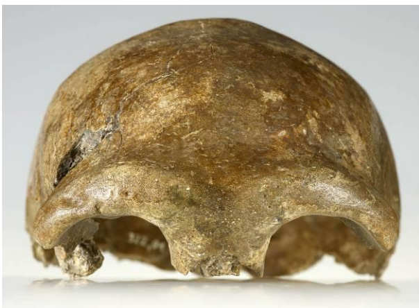
Schädelkalotte des Neandertalers. LVR-LandesMuseum Bonn.