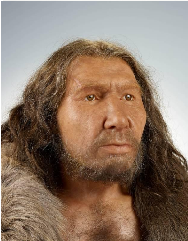
Gesichtsrekonstruktion des Neandertalers. LVR-LandesMuseum Bonn.