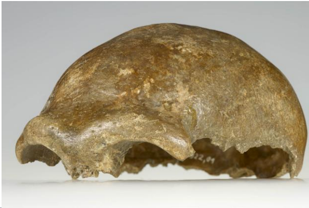
Schädelkalotte des Neandertalers. LVR-LandesMuseum Bonn.