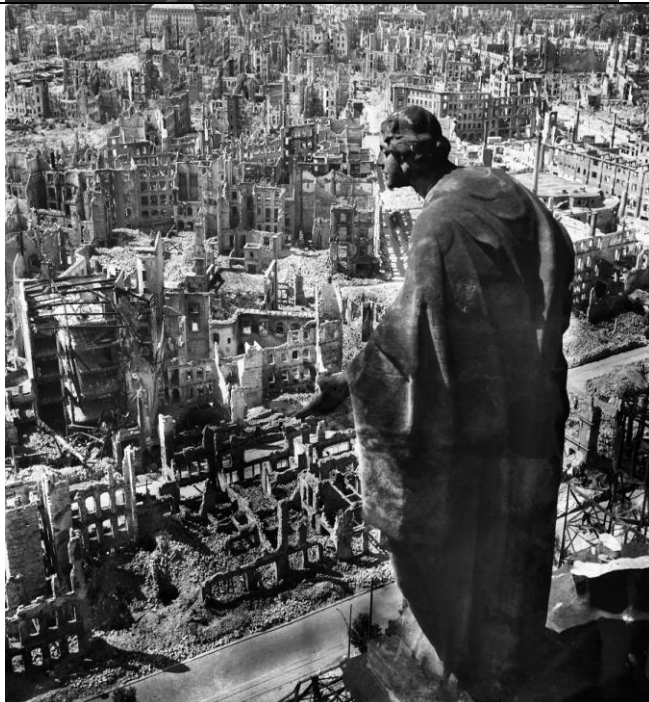
5 Richard Peter sen.

Köln, Hohenzollernbrücke, ca. 1947