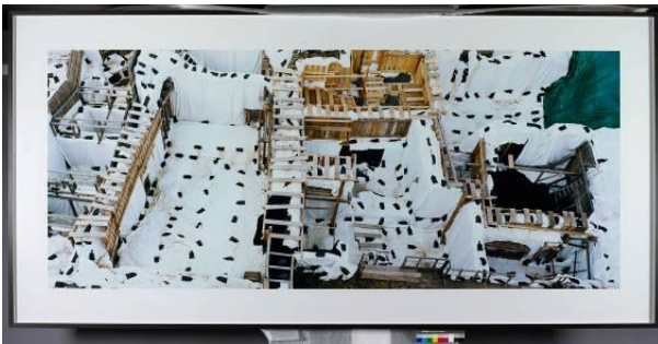
Ausgrabung 2014 © Boris Becker und VG Bild - Kunst Bonn. Sammlung des LVR-LandesMuseum Bonn.