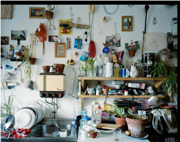
Grünwald 2012 © Boris Becker und VG Bild - Kunst Bonn