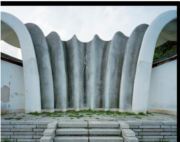
Kurmuschel 2014 © Boris Becker und VG Bild - Kunst Bonn