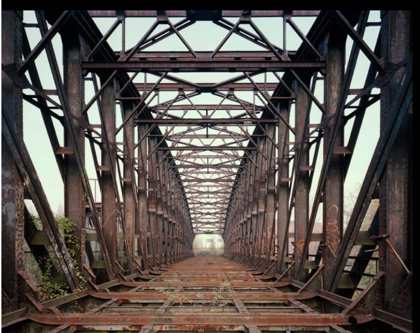
S-Bahn-Brücke 2014 © Boris Becker und VG Bild - Kunst Bonn