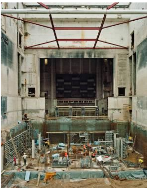
Opernhaus Köln 2013 © Boris Becker und VG Bild - Kunst Bonn