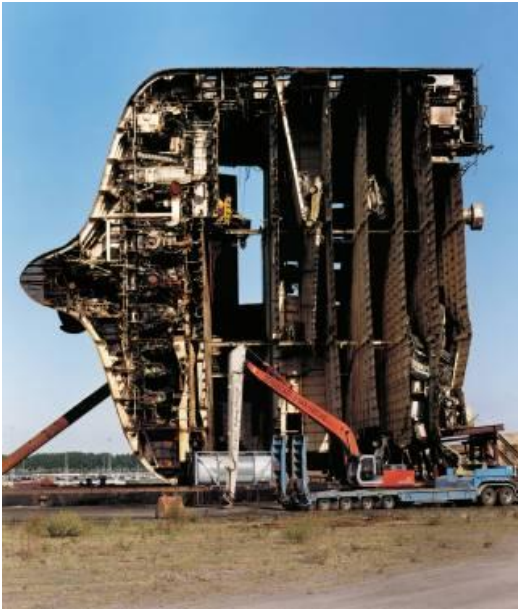
Zeebrugge 2013 © Boris Becker und VG Bild - Kunst Bonn. Die Photographische Sammlung / SK Stiftung Kultur