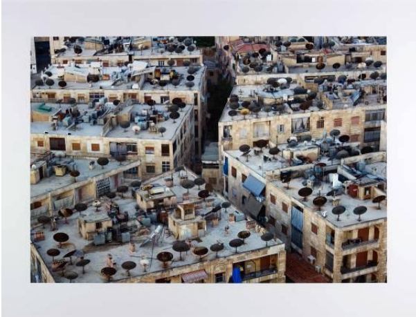
Aleppo, Syrien 2010 © Boris Becker und VG Bild - Kunst Bonn. Sammlung des LVR-LandesMuseum Bonn.

http://www.landestmuseum-bonn.lvr.de/de/presse/pressematerial_neu/pressematerial_neu.html .