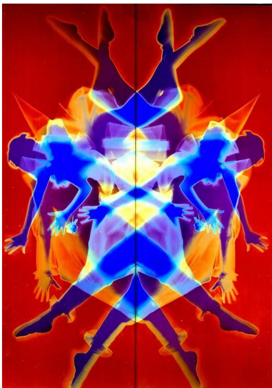
Harlekin und Colombine (Tänzerpaar), 1968