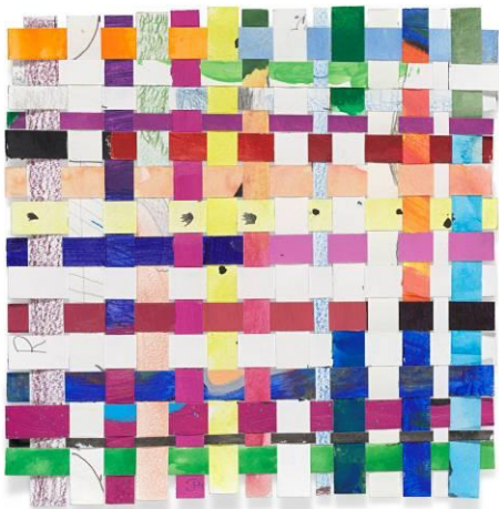
Cony Theis, Farbgitter_mental eingeschränkt 02.