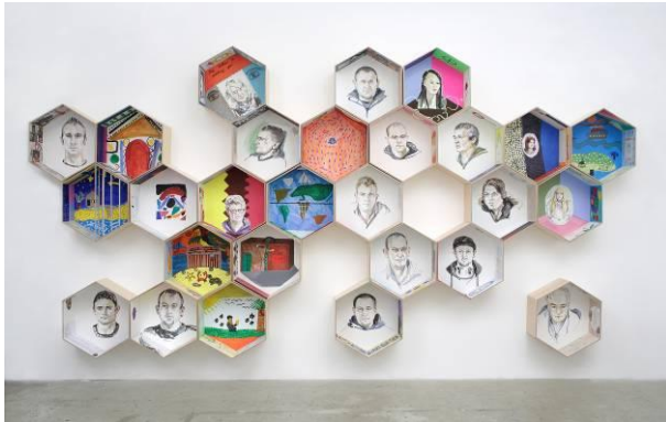
Cony Theis, Waben.

Fotografien in Druckqualität finden Sie auf der beigelegten CD oder auch zum Herunterladen auf unserer Homepage im Pressebereich unter folgendem Link: http://www.landeseuseum-bonn.lvr.de/de/presse/pressematerial_neu/pressematerial_neu.html .